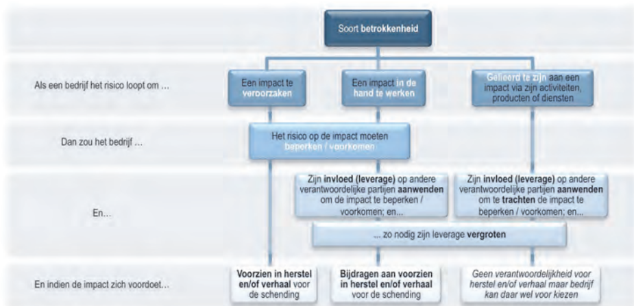
Schema betrokkenheid bij risico's

Het schema is opgenomen met toestemming van Shift Project Ltd en is geen officiële vertaling van de UNGPs.