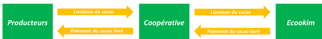
Figure 1: Le schéma des flux financiers entre les producteurs, coopératives et Ecookim.

Les flux financiers et commerciaux pratiqués par Ecookim, ses coopératives et producteurs sont les suivants :